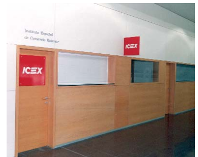
Oficina ICEX en Montjuic/2

Recientemente, el ICEX y Fira de Barcelona han firmado un acuerdo de colaboración consistente en la instalación de una oficina del Instituto en el recinto ferial de Montjuic-2 que permanecerá abierta al público, visitantes y expositores, durante la celebración de todos los certámenes que allí se organicen. La oficina se inaugurará con ocasión del Salón de la Piscina.