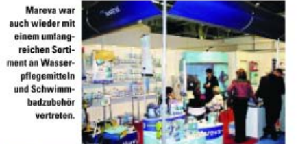
Marea war auch wieder mit einem umfangreichen Sortiment an Wasserpflanzmitteln und Schwimmbadzubehör vertreten.

Peraqua mit automatischem Ventil „Aquastar“ Ein neues automatisches Ventil „Aquastar“ hatte Peraqua mit nach Barcelona gebracht. Es ist für 1,5", 2" und 3" V6 Ventile geeignet. Weitere Kennzeichen des „Aquastar“ sind einfache Montage und Demontage, eine integrierte Handbetätigung sowie druck- und/oder zeitgesteuerte Rückspülluflösung. „Aquastar“ ist nach dem Baukastensystem aufgebaut, und alle Teile lassen sich leicht austauschen. Des Weiteren bietet Peraqua eine neue Serie von Einbauteilen an inklusive Skimmer und Bodenablauf. Der Bodenablauf ist zylindrisch geformt, so dass kein Restwasser darin stehenbleiben kann. Peraqua, Handelsstr. 8, A-4300 St. Veitlen, Tel.: 0043/7435/58488-0